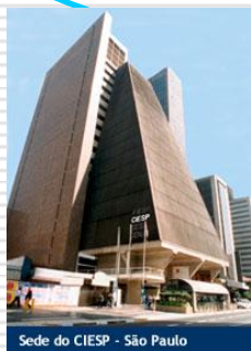
Escritório Central São Paulo